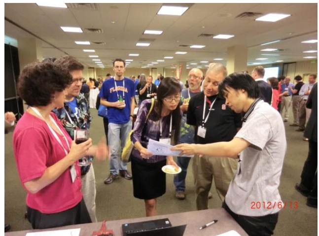
図 2 テクニカルデモ風景

Sakai Conference において Ja Sakai ではここ数年セッションで活動報告を行い、テクニカルデモでもシステム開発事例紹介を行っている。今回は翻訳メモリを使った翻訳を可能とする Eclipse Plugin の Benten を Sakai/Jasig コミュニテ